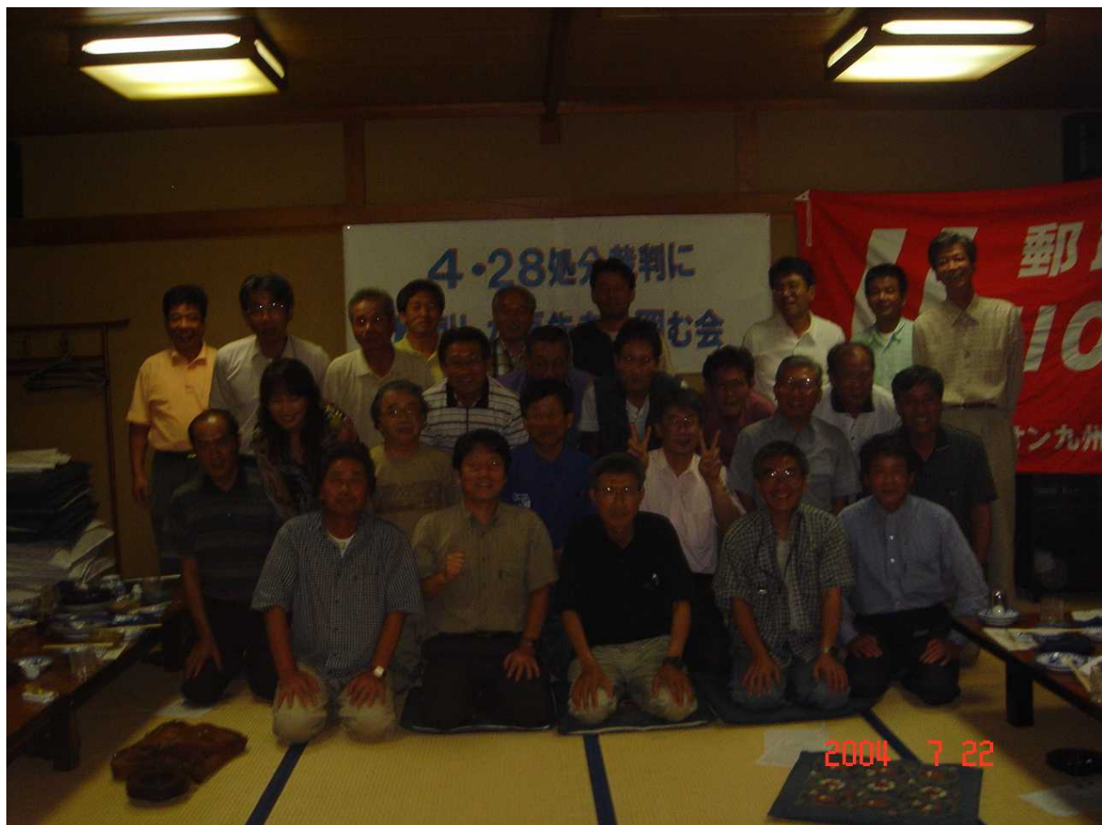
2004年7月 高裁勝利判決、長崎祝勝会