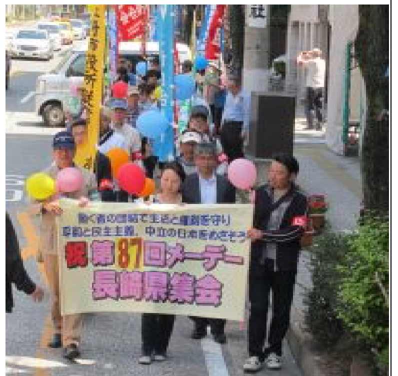
右 87回メーデー行進